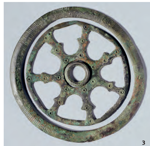
Abb. 3 Bronzene Zierscheibe aus Oberbuchsitzen. Disco ornamentale di bronzo da Oberbuchsitzen.

waren zudem sog. Pressblech-Scheibenfibeln, die zusammen mit Doppelhakenketten den Umhang zusammenhielten. Im alemannischen Osten trugen die Frauen hingegen einfache Gürtel ohne Beschläge. Zu dieser Frauentracht konnten ab der Mitte des 7. Jh. noch ein Ohrringpaar, eine Perlenkette und manchmal auch ein Messer gehören, das am Gürtel hing. Oftmals wurden am Gürtel noch weitere Anhänger getragen wie alte, römische Münzen, Schlüssel oder Zierscheiben. Das Verbreitungsgebiet dieser durchbrochenen Zierscheiben zeigt, dass es Frauen aus Süddeutschland und dem Elsass waren, die diese Mode in das östliche Mittelland brachten.