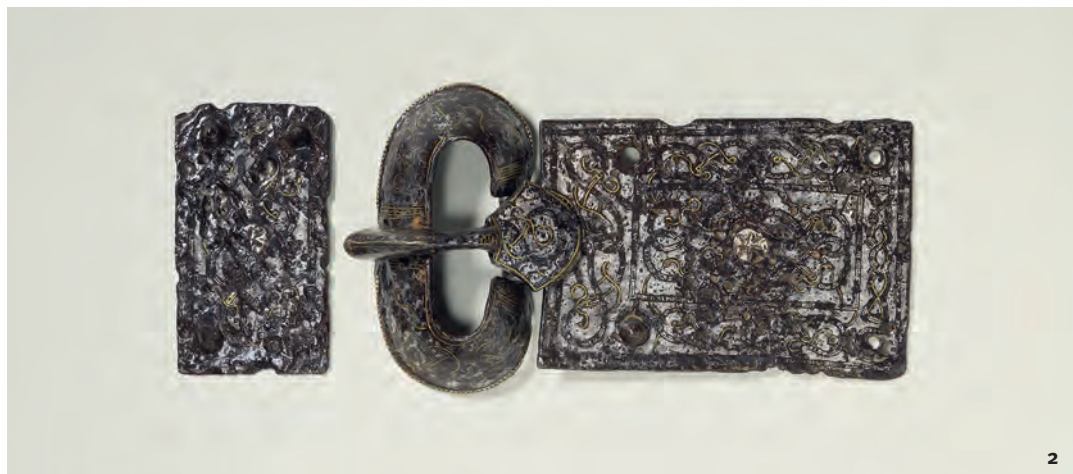
Abb. 2 Eiserne Gürtelschnalle der romanischen Frauentracht aus Grenchen. Fibbia di cintura in ferro, da Grenchen caratteristica del costume femminile di tradizione romana.