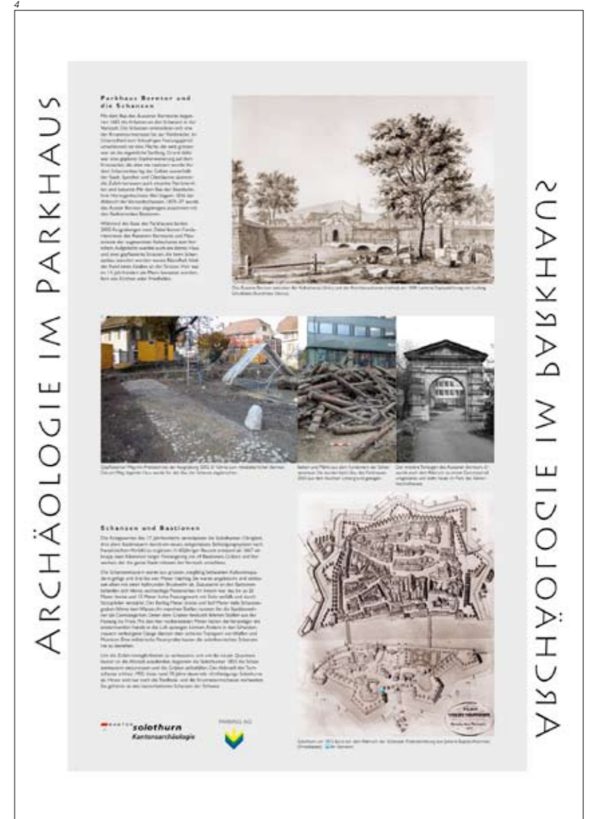
Abb. 4 Informationstafel zum Parkhaus Berntor.