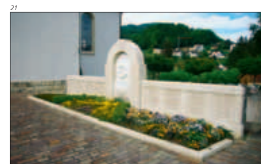
Abb. 21 Das monumentale Grabdenkmal vor der Mümliswiler Pfarrkirche erinnert an die 32 Opfer der Explosionskatastrophe von 1915.