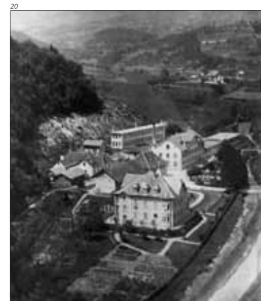
Abb. 20 Das Kammfabrikareal nach dem Ausbau durch Otto Walter-Obrecht um 1903.