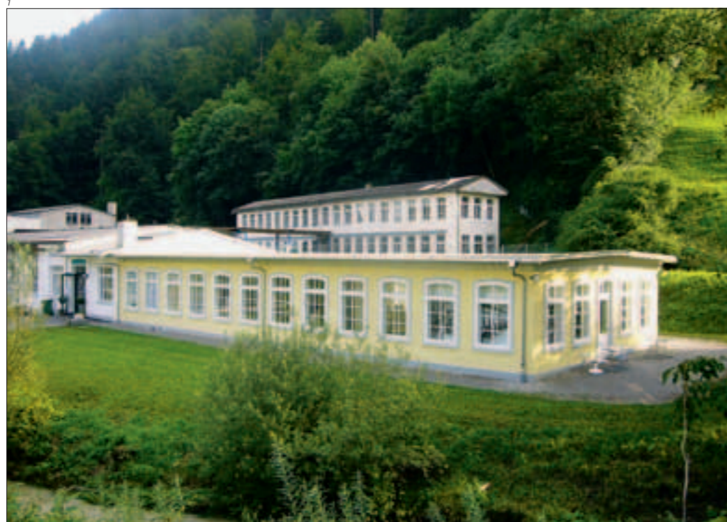
Abb. 1 Mümliswil, Museum HAARUNDKAMM. Ansicht nach der Restaurierung 2007. Das Museum ist heute ein kultureller Magnet im Naturpark Thal.

Zum illustren Kundenkreis gehörten nebst verschiedenen europäischen Adelshäusern der Spanische Hof und die Queen Victoria aus England. Nach ihrem Tod im Jahr 1901 war die Nachfrage der Schmuckkämmen, wie sie die Queen getragen hatte, so gross, dass erhebliche Mengen der Produktion schwarz eingefärbt wurden, um sie in England als Trauerkämmen zu verkaufen.