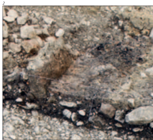
Abb. 1 Büsserach / Galgenhurst. Jungsteinzeitliche Pfeilspitze mit abgebrochener Spitze. M 2:1.

Wegen eines Bauprojektes untersuchten wir im Sommer und im Herbst 2010 eine 1200 Quadratmeter grosse Fläche westlich der Mittelstrasse. Dabei kamen fünf Grubenhäuser sowie Pfostenlöcher von mindestens zwei weiteren Häusern zutage. In einer dieser Bauten fand sich eine Herdstelle; in einem der Grubenhäuser legten wir eine Schmiedeesse frei. Dazu kamen etwa 4 Tonnen Schlacken auf einer mächtigen Deponie, die durch eine Steinsetzung in eine ältere und eine jüngere Phase unterteilt war. Die Bauweise der Grubenhäuser und die Schichtabfolge sprechen für eine mehrphasige Besiedlung, die sich über einige Jahrhunderte erstreckte: Neben einem Grubenhaus-Typ mit Eckpfosten, der ab dem