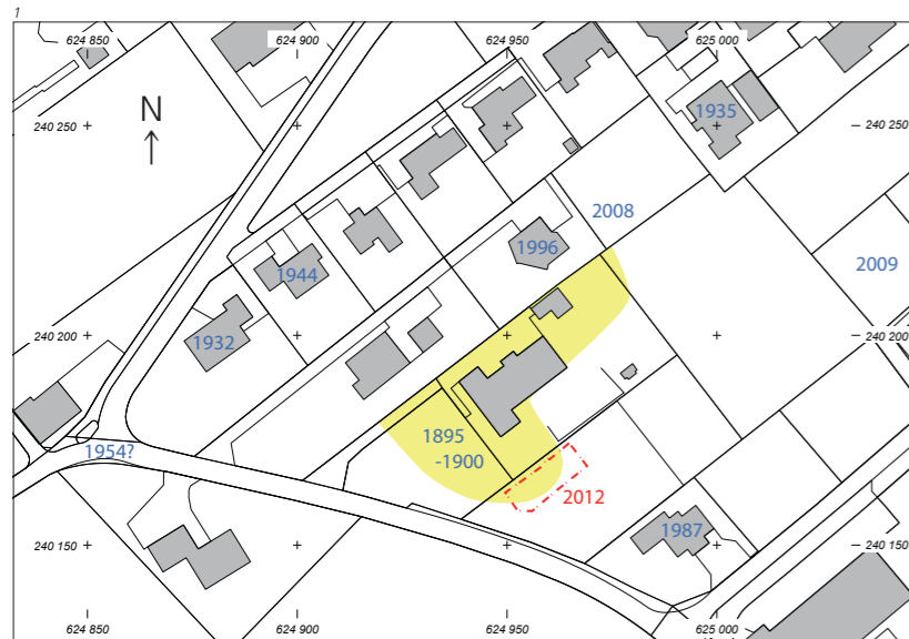
Abb. 1 Oberbuchsiten/Bühl. Lageplan des Gräberfeldes und der ver- schiedenen Ausgrabungen, Sondierungen und Fundmel- dungen. Gelb die ungefähre Grabungsfläche 1895–1900, rot die Grabungsgrenze 2012.

Im Jahre 1909 verkaufte Fey 146 Grabinventare an das Schweizerische Landesmuseum in Zürich. Der Ausgräber und Grundbesitzer durfte damals über die Funde verfügen und sie veräussern; heute gehören alle archäologischen Funde dem Kanton. 1932 kam 150 Meter nordwestlich der Fey-Liegenschaft ein einzelnes Frauengrab zum Vorschein, 1954 in der Nähe davon ein Skelett (Motschi 2007, 18/19, 22 u. 26). Sondierungen auf benachbarten Parzellen in den Jahren 1935, 1944, 1987 und 2009 blieben ergebnislos (Abb. 1). 1996 erhielt die Kantonsarchäologie Gelegenheit, vor dem Bau eines Einfamilienhauses nördlich der Fey-Liegenschaft sieben frühmittelalterliche Gräber freizulegen (Motschi 1997). Die Grabnummerierung wurde mit 501 fortgesetzt, um den hunderten beigabenlosen Gräbern der Altgrabung zumindest indirekt eine Nummer zu geben. Diese sieben Gräber bilden den nordöstlichen Rand des Gräberfeldes, denn bei einer Sondierung im Jahre 2008 in der östlich anschliessenden Parzelle fand die Kantonsarchäologie keine weiteren Gräber mehr. 2007 legte Andreas Motschi die 155 damals bekannten Gräber und ihre Inventare in einer Publikation vor (Motschi 2007).