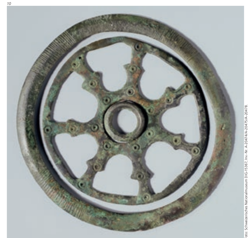
Foto: Schweizerisches Nationalmuseum DiG-15367, Inv.-Nr. A-20474/A-20475/A-20478.

Laut der neuen Umzeichnung des Gräberplanes von 1898 entspricht Grab 602 wahrscheinlich Grab 98, das um 600/610 bis 630 n. Chr. datiert. Der Tote in Grab 98 trug eine silbertauschierte Gürtelschnalle und war mit einem Breitsax sowie zwei Pfeilen bewaffnet. Eine dritte Pfeilspitze würde gut zu diesem Inventar passen. Der Feuerstein fällt hingegen ein