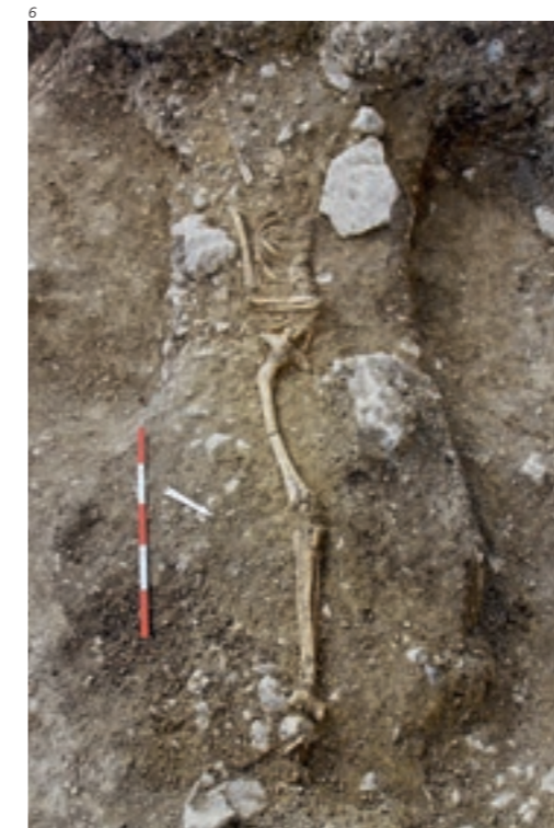
Abb. 7 Grab 607 mit Steineinfassung an der östlichen Längsseite. Direkt links anschliessend befand sich das von Grab 607 geschnittene Grab 614. Blick gegen Südwesten.