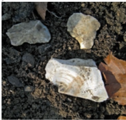
Abb. 6 Mögliche Abbaustelle in der Nähe des Seidenhofloch- weihers.

Während sich rund um das Reservoir im Förenwald eine weniger fundreiche Zone befindet, schliesst im Norden eine weitere Fundkonzentration an. Auf einer Terrasse aus lockerem Sediment (Nr. 34) stiess man auf zahlreiche Silexartefakte (Abb. 5). Darunter sind auch einige Werkzeuge, wie Kratzer und Bohrer. Möglicherweise befand sich hier einst ein Schlagplatz oder ein zeitweiliger Lagerplatz der steinzeitlichen Bergleute. Da sich die Stücke in Grösse und Gewicht relativ ähnlich sind, ist es aber auch möglich, dass sie von höherliegenden Fundplätzen angeschwemmt wurden. Auch westlich des Reservoirs finden sich Silices im Bereich umgestürzter Baumstämme. Sie sind häufig durch Bohnerzeinlagerungen gelblich und rötlich verfärbt. Dieser Befund deckt sich mit der geologischen Karte.