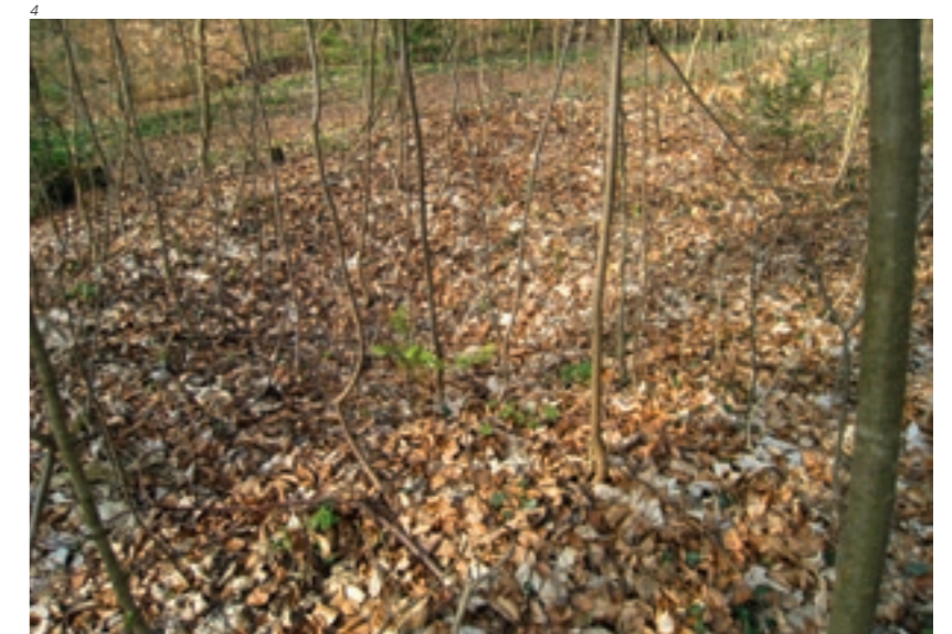
Abb. 4 Pingenartige Vertiefung im Förenwald.