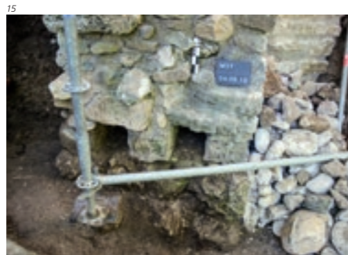
Abb. 15 Mauer M12. Die zwei Öffnungen in der Bruchfläche der Mauer sind durch das Verfaulen der ursprünglich darin eingelegeten hölzernen Maueranker entstanden. Aufnahme 2012; von Südwesten.