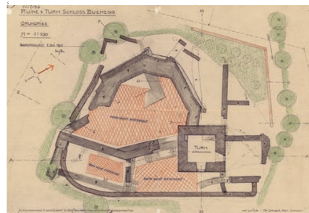
Plan: F. Gruber, Dornach

Die Sanierung von 2012 beinhaltetete keine archäologischen Ausgrabungen. Die Mauerzüge wurden lediglich so weit freigelegt, wie es für deren Konservierung notwendig war. Bodeneingriffe wurden nur vorgenommen, wenn es für die Sanierung eines Mauerfundamentes unerlässlich war. Sämtliche Mauerzüge wurden vor und nach der Konservierung mit Fotos dokumentiert. Drei anlässlich der Sanie-