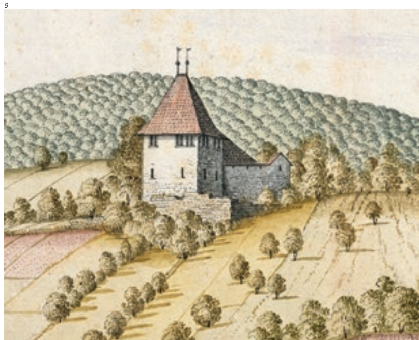
Abb. 9 Das «Buechischlössli» von Norden. Ausschnitt aus einem Gemälde von Albrecht Kauw, um 1660. Bernisches Historisches Museum, Bern.