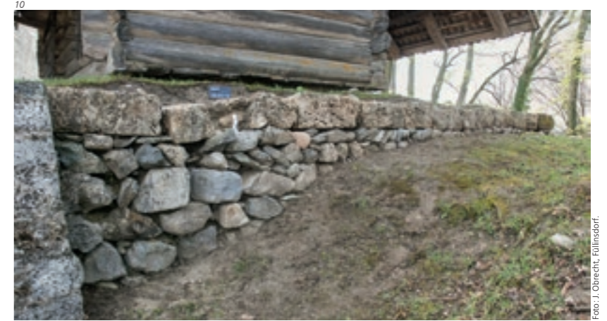
Abb. 10 Freiliegendes Fundament der Mauer M24. Es besteht mehrheitlich aus kristallinem Steinmaterial. Aufnahme 2012; von Nordwesten.

Die entlang der Kante des südwestlichen Grabens verlaufende Mauer M22 besteht aus kleinteiligem und sicher mehrheitlich wiederverwendetem Steinmaterial (Abb. 13). An der Basis ist sie 1,1 Meter breit und kaum fundamementiert. Auf der Aussenseite zum Graben hin besitzt sie einen so starken Anzug, dass sie auf einem Meter Höhe bereits auf fast 80 Zentimeter verjüngt ist. Von ihrer Konstruktion und ihrem