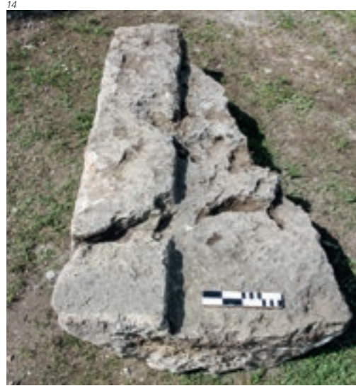
Abb. 14 Türgwändestein aus Tuff. Er diente während Jahrzehnten als unterster Tritt der Treppe zum Turmeingang. Aufnahme 2012.