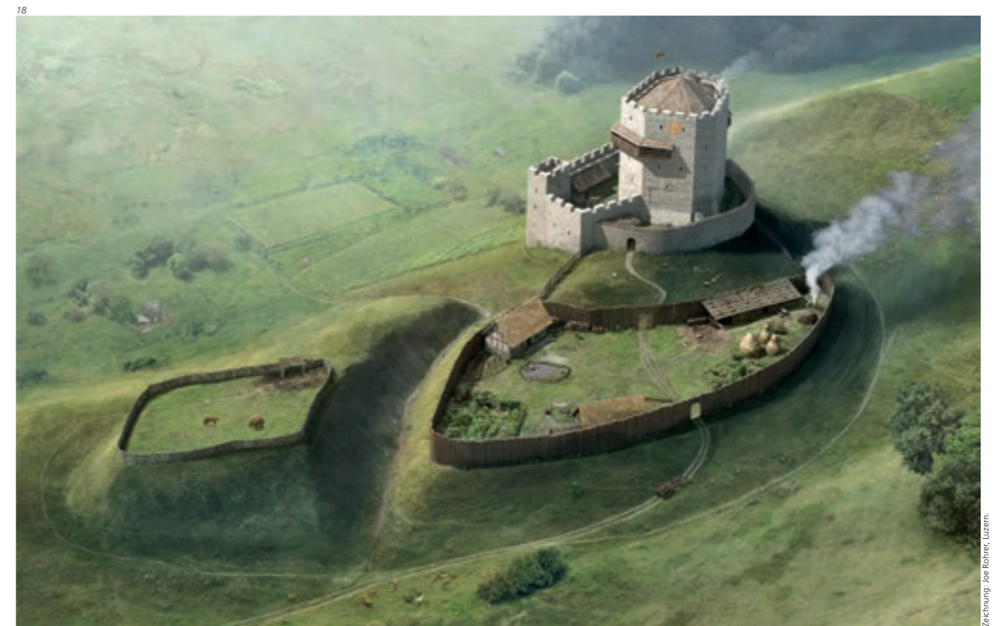
Abb. 18 Lebensbild. Rekonstruktionsversuch, basierend auf allen heute noch sichtbaren Elementen der Burgruine – Gräben, Vorburg, Kernburg und Wohnturm.

Abb. 17 Mauer M11 von Südosten. Der deutlich erkennbare Wechsel im Mauercharakter in der Mitte des Bildausschnittes deutet darauf hin, dass hier zwei Bauetappen vorliegen. Aufnahme vom August 1941.