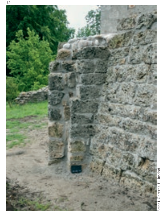
Abb. 13 Mauer M22 nach ihrer Freilegung und Reinigung. Aufnahme 2012; von Nordwesten.