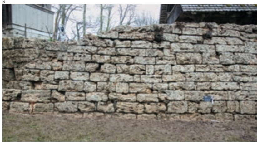
Abb. 8 Mauer M26 aus Tuffsteinquadern nach der Entfernung des Pflanzenbewuchses und der Moospolster. Aufnahme 2012; von Norden.