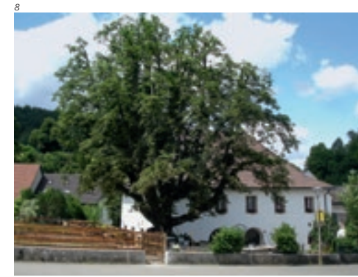
Abb. 7 Erschwil, Kreuzbrücke, Ansicht nach der Restaurierung.