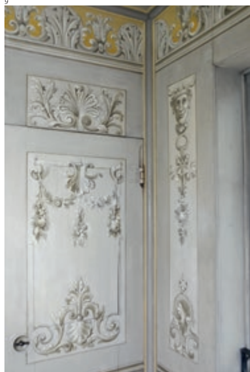
Phoenix Restaura, Biel

fernen der störenden Retuschen, Konsolidierung der Malerei, Regeneration der ausgemagerten Malereischicht, zurückhaltende Retuschen der Fehlstellen – ist der Bestand gesichert und das Bildmotiv wieder besser lesbar.