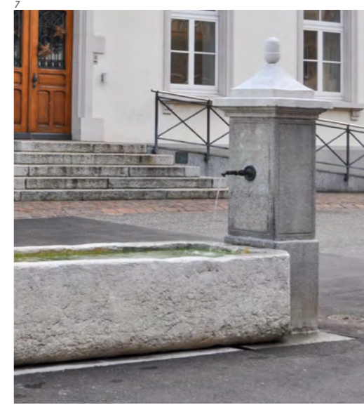
Abb. 7 Erlinsbach. Der neu platzierte und restaurierte Dorfbrunnen. Foto 2016.

Der Dorfbrunnen besteht aus einem grossen Kalksteintrog und einem jüngeren Stock aus Zementstein. Der schlichte Trog ist in zwei Becken unterteilt und war früher mit geschmiedeten Eisenauflegern zum Abstellen der Eimer ausgestattet. Ehemals befand sich der Stock an der Längsseite des Troges. Er wurde wohl um 1900 durch einen Zementstock er-