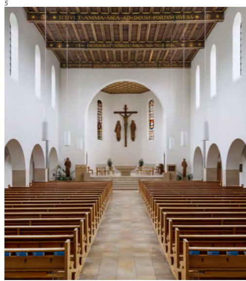
Abb. 6 Derendingen, reformierte Kirche. Ansicht des Turmhelms nach der Sanierung 2015/16. Foto 2017.