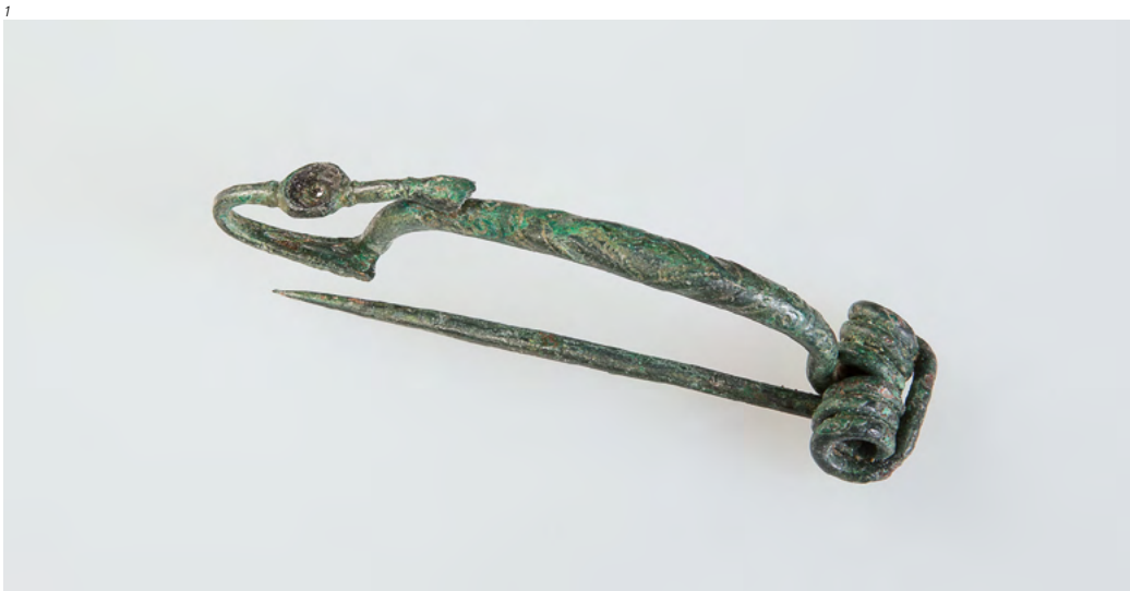
Abb. 1 Die keltische Bronzefibel kam 1929 in einem Grab in Recherswil zum Vorschein. Um 400–350 v. Chr. M 1:1.

In den folgenden Jahren wurde nie mehr ein Versuch unternommen, die Fibel einzufordern. In der 1979 publizierte Arbeit von Alexander Tanner zu den Latènegräbern der nordalpinen Schweiz wird die Fibel aus Recherswil als verschollen aufgeführt.