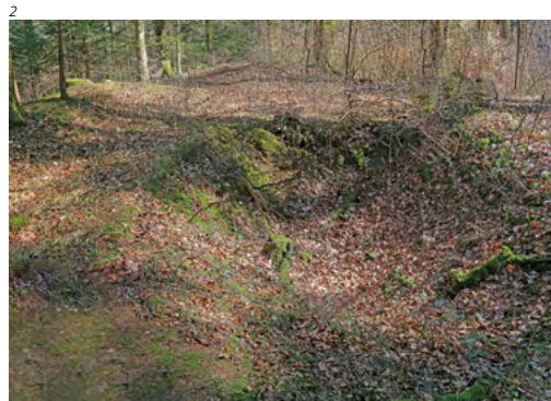
Abb. 1 Aedermannsdorf/Schmelzi. Stark mit Moos überwachsene Abraumhalde im neu ent- deckten Abbaufeld.