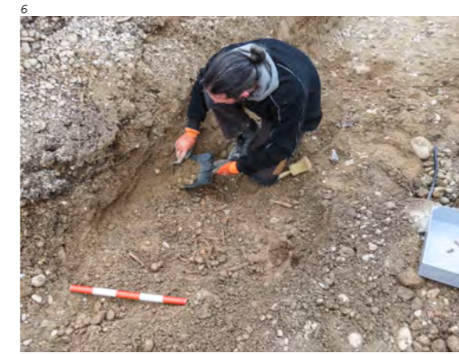
Abb. 6 Grenchen/Eusebiuskirche. Ein Mitarbeiter der Kantons- archäologie bei der Freilegung eines der stark gestörten Skelette.

Von Januar bis Mai 2020 wurden bei der Eusebiuskirche in Grenchen verschiedene Umgebungsarbeiten durchgeführt. Beim Aushub für das Fundament einer neuen Stützmauer westlich der Kirche kamen menschliche Knochen zum Vorschein. Mitarbeitende der Kantonsarchäologie legten acht Skelette frei, die von verschiedenen Leitungen und anderen Ein-