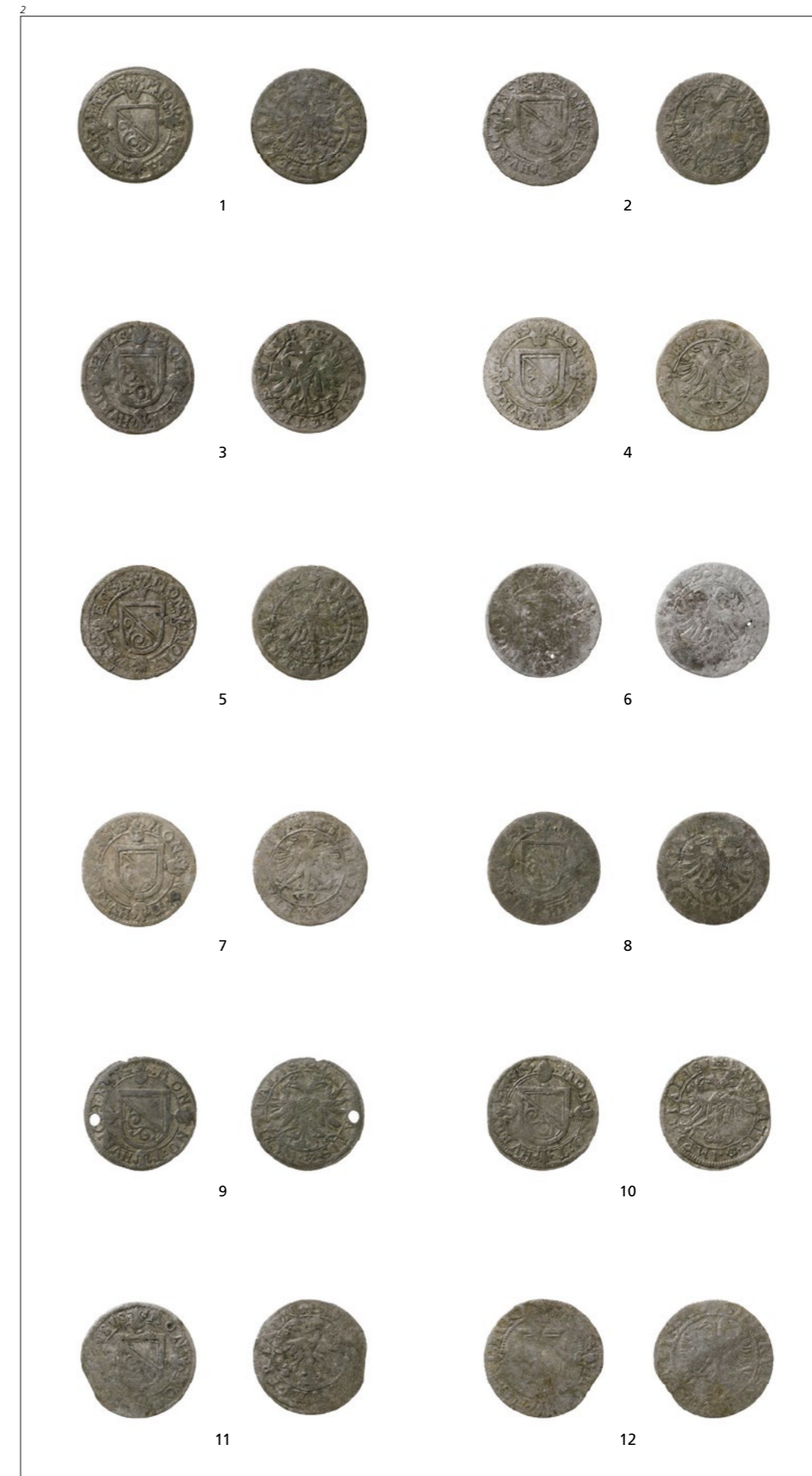
Abb. 2 1–12 Schillinge der Stadt Zürich mit dem Zürcher Wappen auf der Vorderseite und dem doppelköpfigen Reichsadler auf der Rückseite. Serie wohl geprägt um 1623–1638/39. M 1:1.