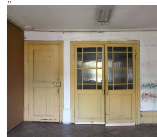
Abb. 10 Solothurn, Baselstrasse 58, Schloss Steinbrugg. Dom- herrensaal nach der Restau- rierung 2023.