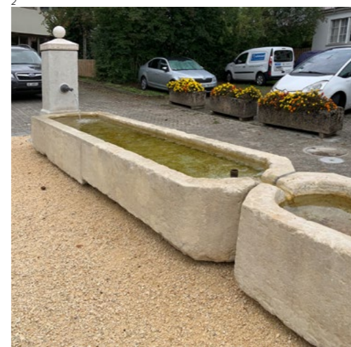
Abb. 2 Biezwil. Der restaurierte Brunnen 1780.