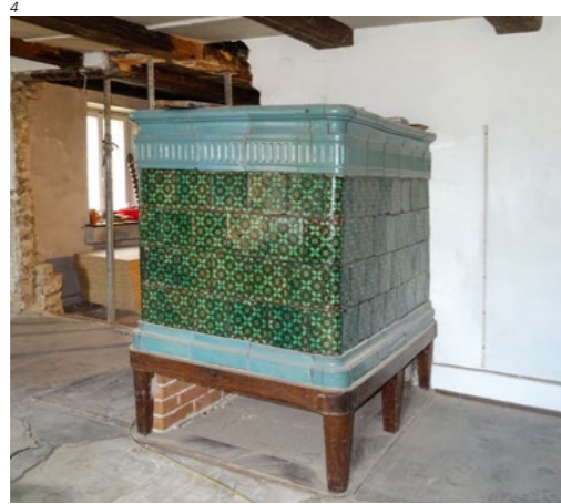
Abb. 4 Himmelried, Kaltbrunnental- strasse 36. Der Kachelofen vor der Restaurierung, Foto 2020.