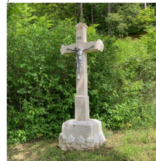
Abb. 3 Breitenbach. Das 2022 restaurierte Wegkreuz an der Fehrenstrasse.

Auch das Wegkreuz an der Fehrenstrasse ist erhaltenswert, besitzt einen gegossenen Metallkorpus und ist mit der Jahreszahl 1922 datiert. Es stand östlich ausgangs des Dorfs und musste wegen einer Überbauung über die Strasse versetzt werden. Nebst Reinigung durch Sandstrahlen und Neuverzinkung der Christusfigur wurden die vier Kreuzteile gereinigt sowie neu verdübelt und verklebt. Kleinere Fehlstellen wurden mit Mörtel ergänzt, die Jahreszahl patiniert. Zudem erhielten die Sichtflächen einen farblosen Schutz auf Silanbasis. Das restaurierte und versetzte Kreuz steht nun gut sichtbar an der Einmündung eines Waldweges in die Fehrenstrasse. Das kantonal geschützte Wegkreuz an der Rohr-