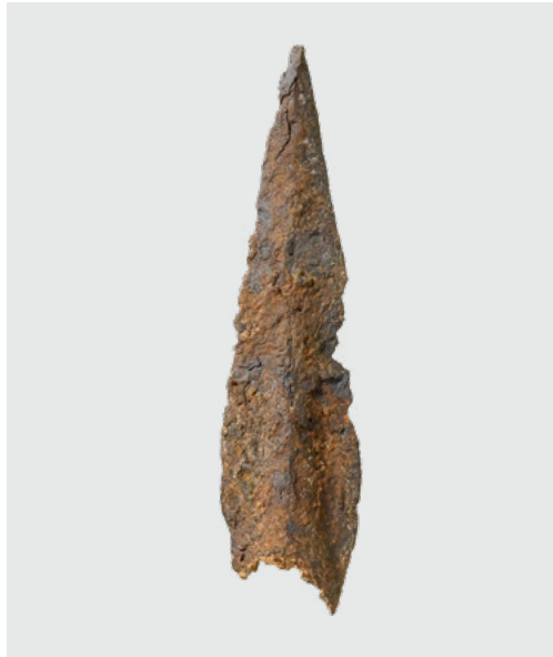
Abb. 21 Zuchwil/Emmenschachen. Pfählschuh aus dem Spät- mittelalter oder der frühen Neuzeit auf einer Kiesbank der Emme.