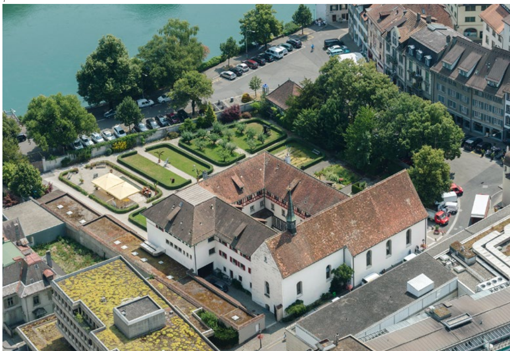
Abb. 1 Olten, Kapuzinerkloster. Die Klosterkirche und die Konventbauten sind nördlich der Altstadt um einen Innenhof angeordnet. Östlich davon befindet sich aareseitig der Klostergarten. Flugaufnahme 2015.

Mit der Inventarliste liegt nun erstmals eine Übersicht über das bewegliche Kulturgut vor. Die Dokumentation umfasst primär die Gemälde, die Skulpturen und die liturgische Ausstattung. Das Mobiliar ist nicht Teil des Inventars. Ebenso wurde die Bibliothek nicht erfasst, deren bedeutendste Werke an die Zentralbibliothek Solothurn gelangten. 4 Die Paramente, Kleider und Stoffe, die zur Durchführung der Gottesdienste benötigt wurden, sind seit 2021 inventarisiert und befinden sich grösstenteils im Historischen Museum Olten. 5