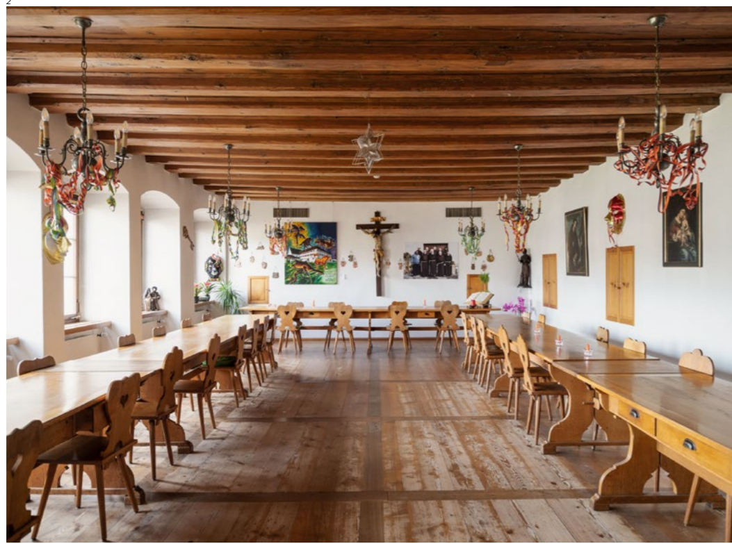
Abb. 2 Olten, Kapuzinerkloster. Refektorium mit langen, in einem Halbkreis angeordneten Tischen, historischen Gemälden und einem Kruzifix mittig an der Wand. Foto 2023.