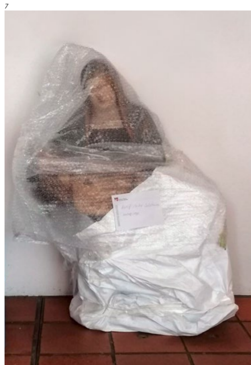
Abb. 7 Olten, Kapuzinerkloster. Holz- skulptur der Pietà, von den Zivilschützerinnen und Zivil- schützern transportfertig ver- packt. Foto 2024.