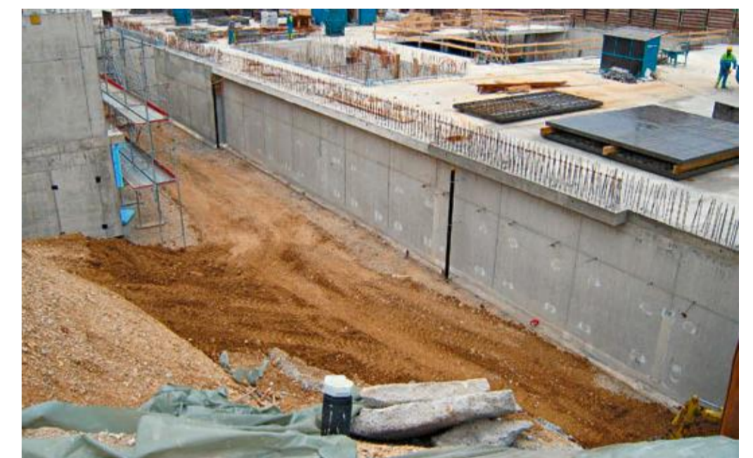
Abdichtung - dichte Bauweise