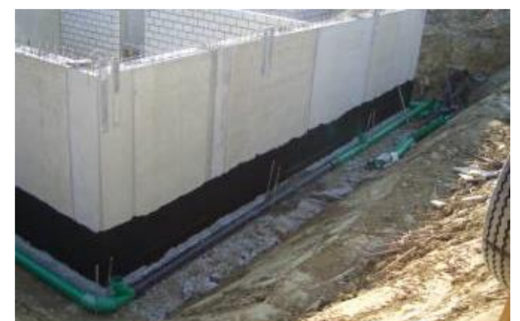
Kombination – Abdichtung / Umleitung