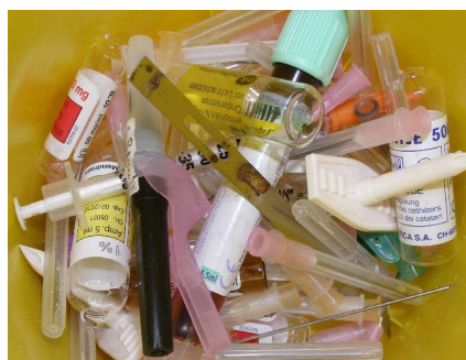
Medizinischer Abfall Gruppe B2

Verschiedene Entsorgungsfirmen bieten Abhol – und Entsorgungsdienstleistungen für medizinische Abfälle an.