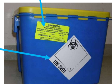
Med. Abfall verpackt und beschriftet

Die beschriebenen Massnahmen gelten für Mengen innerhalb der Freigrenze bis 333 kg. Bei grösseren Ladungen gelten zusätzliche Vorschriften nach ADR/SDR. Es wird empfohlen bei Entsorgungsmengen von > 333 kg auf spezialisierte Transportunternehmen beizuziehen.