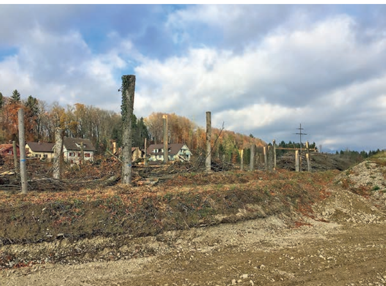
Gerodete Fläche im Giriz. Die noch stehenden Baumstämme werden im Los 4 als Ufersicherung eingebaut (Bild rechts: ingenieurbioologische Massnahmen an der Aare).

Während den Bauarbeiten sind Beeinträchtigungen und Einschränkungen für die Anwohnerschaft und Naherholungssuchende unvermeidbar. Wege entlang der Emme sind aus Sicherheitsgründen zeitweise nicht zugänglich. Umleitungen werden frühzeitig angekündigt und signalisiert. Die Bauherrschaft und die beauftragten Unternehmen bemühen sich, die Beeinträchtigungen auf ein Minimum zu beschränken. Wir bitten die betroffene Bevölkerung um Verständnis.