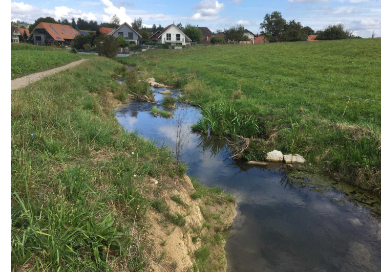
Revitalisierung nach einem Jahr