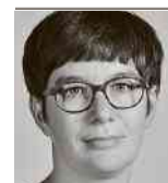
von Doris Kleck

Eigenmietwert). Doch der Widerstand gegen die Abschaffung von Steuerabzügen ist gross. Für junge Familien würde der Erwerb von Wohneigentum schwie-