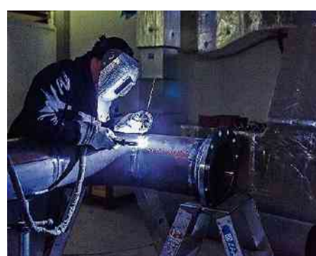
Zusammengeschweisst wird vor Ort.