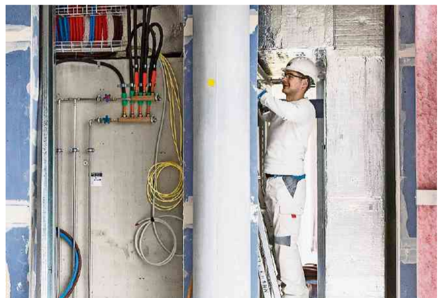
180 Handwerker arbeiten täglich auf der Baustelle.

Auf solche «Testareale» trifft man auf der Baustelle immer wieder. Hier sind schon gläserne Trennwände montiert, als ob ein Labor bereits in Betrieb wäre. Da sieht eine Decke mit Lampen und Sprinkleranlage schon fixfertig aus. Mit diesen Praxistests lassen sich teure Nachbesserungen vermeiden. Zum Beispiel hat sich herausgestellt, dass die ursprünglich gewählte Oberflächenstruktur von gläsernen Wandelementen zwar ästhetisch überzeugt, aber dennoch nicht infrage kommt, weil die Reinigung viel zu aufwendig gewesen wäre.