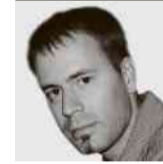
von André Ballin, Moskau

K urz vor der russischen Präsidentschaftswahl verschärft sich der Konflikt zwischen Russland und dem Westen: Nach Grossbritannien haben nun auch die USA neue Sanktionen gegen Moskau verhängt; die einen wegen eines mutmasslichen Giftgasanschlags, die anderen wegen ebenso mutmasslicher Einmischung in den US-Wahlkampf. Mos-