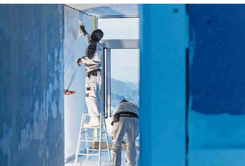
wird schon einmal ein Patientenzimmer fixfertig eingerichtet.