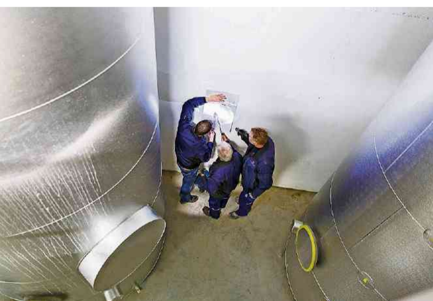
läuft nach Plan.

Auch im Kanton tut sich was. Laut Vize-Stadtpresident und Kantonsrat Remo Bill (SP) haben sich die Grenchner Kantonsräte getroffen und einen Vorstoss formuliert, der in der nächsten Session am 20. März eingereicht werden soll.