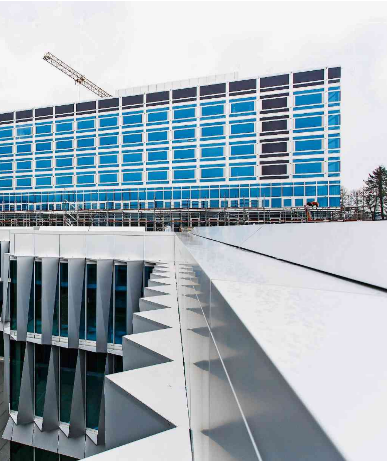
wird. Das Bettenhaus soll im Sommer 2020 bezugsbereit sein, dann wird das alte Hauptgebäude abgerissen.

Mehr als bezweifelt wird im jetzigen Einspracheverfahren auch, ob bisherige Anlässe wie die «Authentica» oder «Advent im Kloster» überhaupt hätten bewilligt werden dürfen. Von Einsprecherseite wird dagegen betont, man habe bisher ja nichts gegen die Anlässe gehabt und sie toleriert. Sollten gar Veranstalter auf sie zukommen, lasse man durchaus mit sich reden. Durchblicken lässt man aber auch, dass es vor allem Opposition gebe, weil ein bekannter Partyveranstalter wie Urs Bucher exklusiv und zu erweiterten Öffnungszeiten das Kloster nutzen könne - was eben Befürchtungen betreffend die Ruhe im Quartier auslöse.