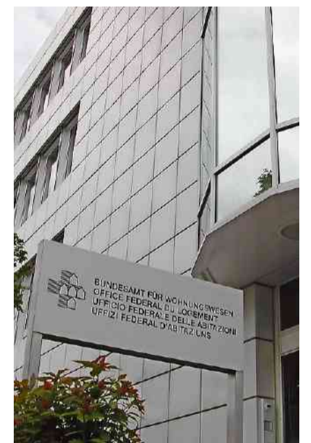
Ungewisse Zukunft hinter den Mauern des Bundesamtes.

Interpellantin Heim stellt die Frage, «mit welchen messbaren Zielsetzungen, Leistungen und mit welchen Ressourcen dem Verfassungsauftrag aus dem Artikel 108 entsprechend der Wohnbau- und Wohneigentumsförderung bisher entsprochen wurde und wie dies in Zukunft mindestens im sel-