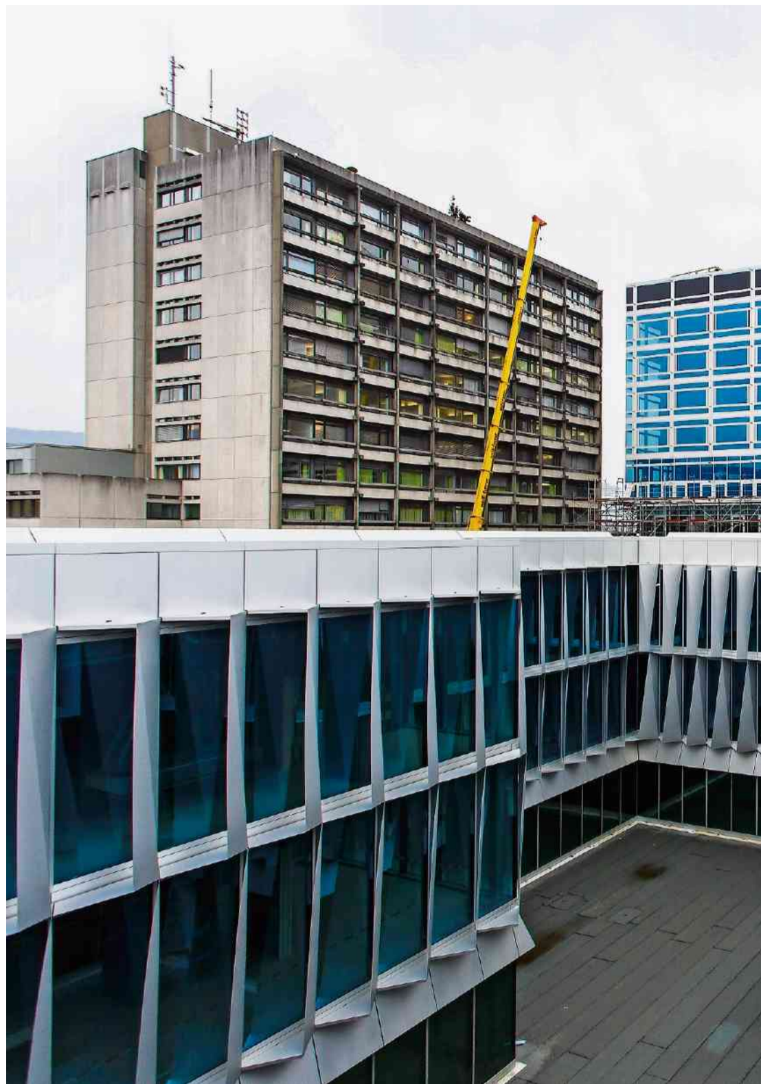
Blick über den Lichthof auf die Fassade des Neubaus, die jetzt mit den «Brise Soleil»-Elementen bestückt

Die Arbeiten am Neubau des Bürgerspitals Solothurn schreiten planmässig voran. Bis heute wurden Bauaufträge für 243 Millionen Franken vergeben, dieses Jahr werden 60 Millionen «verbaut».