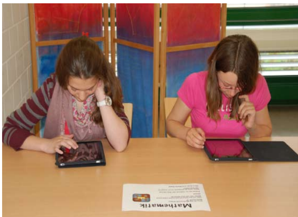
ICT: Sinnvolle Nutzungsmöglichkeiten im Unterricht.

Hier finden Sie das PISA-Portrait des Kantons Solothurn im Internet