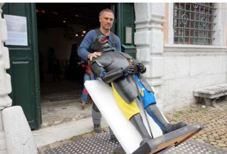
Der Joggeli verlässt das Museum altes Zeughaus.... ...und zieht zu einem Cousin auf Schloss Waldegg.