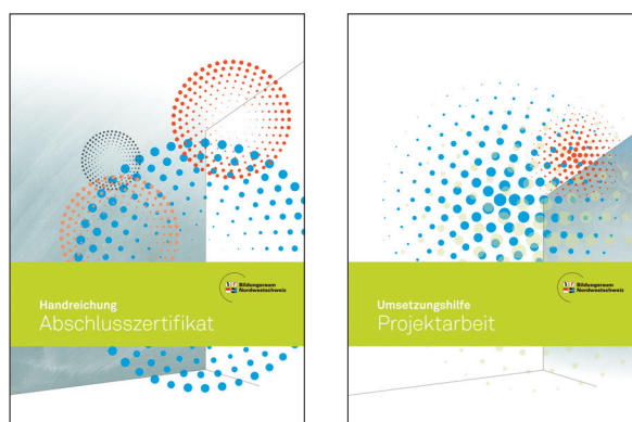
Handreichung Abschlusszertifikat und Umsetzungshilfe Projektarbeit

Für Lehrpersonen und Schulleitungen der Sekundarstufe I 1 bestehen zusätzlich zur Handreichung umfassende Unterstützungsangebote zur Umsetzung des Abschlusszertifikats beziehungsweise der Teilzertifikate im Unterricht. Es sind dies die inhaltlichen Referenzrahmen der Checks, die Handreichungen zu den Ergebnisrückmeldungen der Checks, die «Umsetzungshilfe Projektarbeit» inklusive Bewertungsraster und diverser Arbeitsmaterialien wie auch entsprechende Weiterbildungsangebote. Ausführliche Informationen sind zu finden unter www.check-dein-wissen.ch und auf den Internetseiten der vier Kantone des Bildungsraums Nordwestschweiz (siehe Kapitel 4).