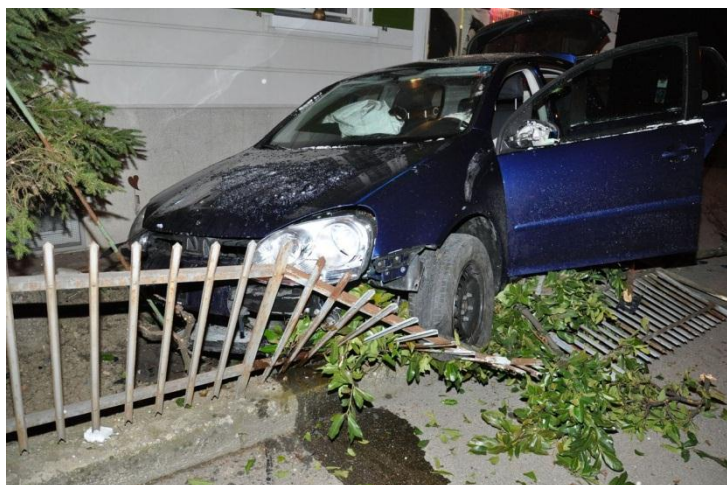
Unfall vom 14.3.2013/ Riedernstrasse, Grenchen

In Grenchen kam es am Freitag, 15. März 2013, zwischen 7 und 8 Uhr zu sieben weiteren Verkehrsunfällen. Bei diesen waren insgesamt 14 Autos, ein Lieferwagen und ein Lastwagen beteiligt. Die Unfälle ereigneten sich aufgrund der winterlichen Strassenverhältnisse. Personen wurden keine verletzt. An den Fahrzeugen entstand ein Gesamtschaden von mehreren tausend Franken.