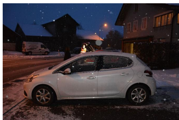
Fahrzeug der Geschädigten