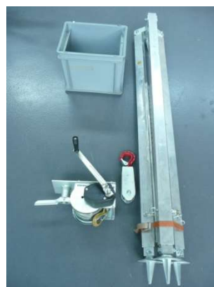
Lasten Dreibein mit Winde