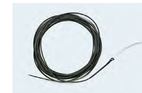
Sinktipp mit Tungstentaub zur Beschwerung (Fliegenfischen)