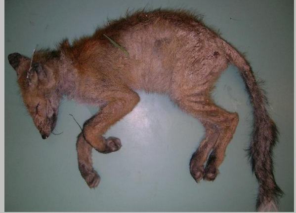
Abb. 3. Rüdiger Fuchs, tot aufgefunden: Der ganze Körper ist mit dicken Krusten bedeckt und der Haarausfall ist fast überall stark ausgeprägt.

grosse Verluste erleidet. In Gebieten, in denen die Räude schon lange vorhanden ist, treten hingegen oft nur vereinzelte Fälle auf, als ob die Population ein gewisse Resistenz gegenüber der Krankheit entwickelt hätte (im Sinn einer natürlichen Selektion). Über längere Zeitperioden beobachtet man ein zyklisches Auftreten der Krankheit.