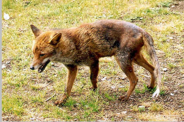
Abb. 2. Rüdiger Fuchs, lebend: Der Haarausfall und die schwarze Verfärbung der Haut sind im Bereich des hinteren Rückens und der Oberschenkel gut sichtbar.