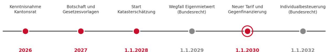
Abbildung 2: Meilensteine zur Umsetzung der Steuerstrategie 2030.

Die Reihenfolge ist sachlich zwingend: Die Gegenfinanzierung muss zeitlich vor der Tarifsenkung greifen, damit die Reform finanzpolitisch tragfähig bleibt. Die höheren Katasterwerte treffen die Wohneigentümer zudem erst, nachdem der Eigenmietwert bundesrechtlich weggefallen ist.